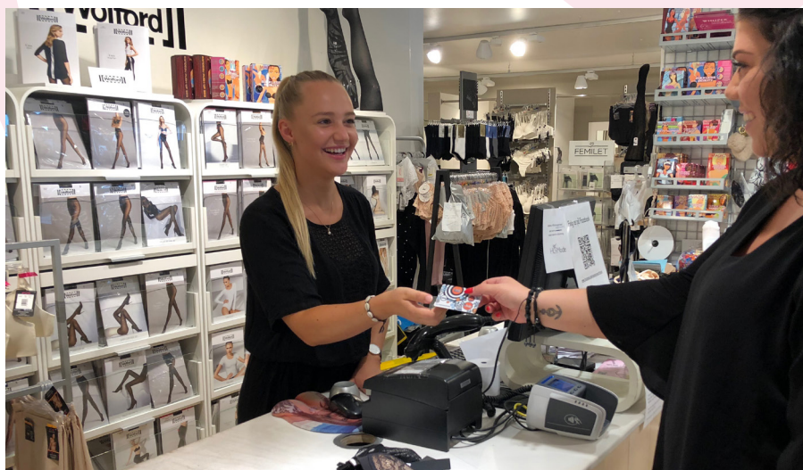
Gavekortet i brug hos HL Mode, Slotsgade

Hillerød Shopping Gavekort omsatte i 2020 for 3,05 mio. kroner.